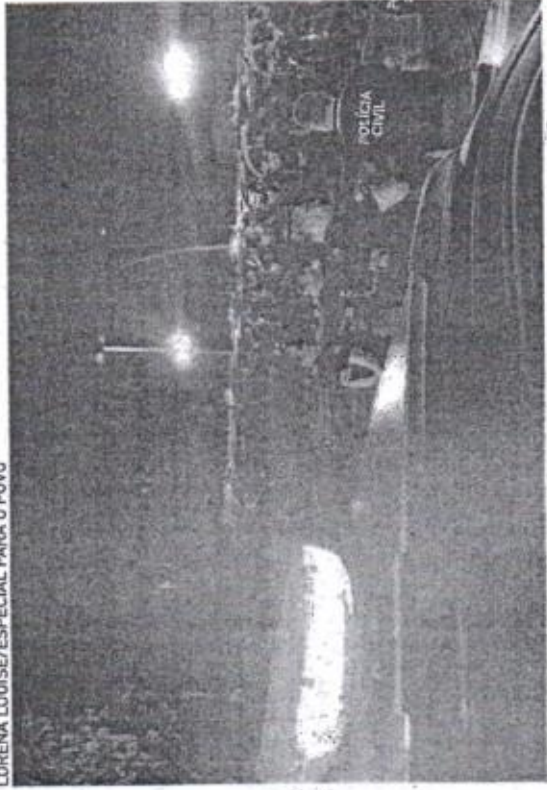
INÍCIO de operação policial no Centro Integrado de Segurança Pública