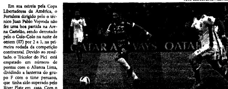
Com o resultado negativo, o Fortaleza sofreu a sua primeira derrota na atual temporada de 2022

Na primeira partida de um clube cearense na história do torneio, o Tricolor do Pici em atuação ruim foi derrotado pela equipe chilena