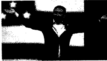
Andrew Yang, ex-democrata, é um dos líderes que encabeça o novo partido político

Com elei, dezenas de ex-filiados dos partidos tradicionais, parte deles com experiência no governo - uma das forças políticas que formam o novo partido é o Movimento de Renovação dos EUA (Renew America Movement), que reúne ex-membros de administrações republicanas. Os EUA já têm uma série de partidos menores,