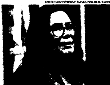
A proposta de emenda à Constituição é de autoria da deputada bolsonarista Bia Kicis (PSL)

Solenidade. A Assembleia Legislativa do Ceará realiza hoje uma sessão solene para celebrar 100 anos da Associação de Travestis e Mulheres Transsexuais do Estado do Ceará (Atmace). A solenidade atende a requerimento do deputado Renato Rosero (Psol) e acontecerá no Plenário da casa.