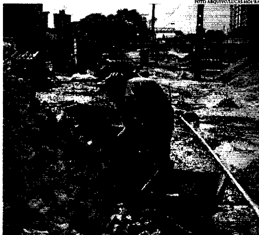
Segundo Sinduscon-CE, de quase sete mil funcionários, 320 foram contaminados com covid-19 em Fortaleza

Pronamep. A Confederação Nacional do Comércio de Bens, Serviços e Turismo (CNC), solicitou ao Ministério da Economia e à Federação Brasileira de Bancos, a prorrogação da carência para início do pagamento dos empréstimos do Programa Nacional de Apoio às Microempresas e Empresas de Pequeno Porte (Pronamep).